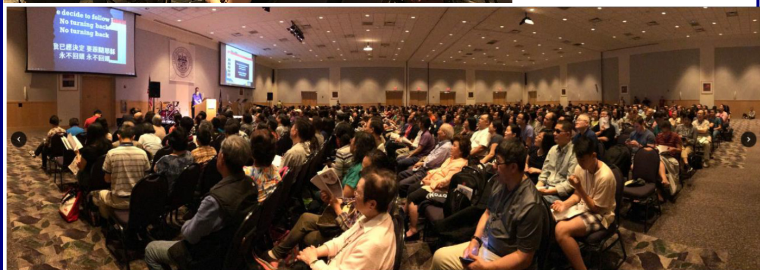
(上圖) 全體會眾一起聆聽神的訊息。