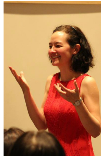
音樂鋼琴家仙杜拉·沈姐妹作個人服事感恩見證。