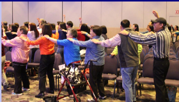
(上圖) 跳舞？體操？有誰知道他（她）們在做啥？