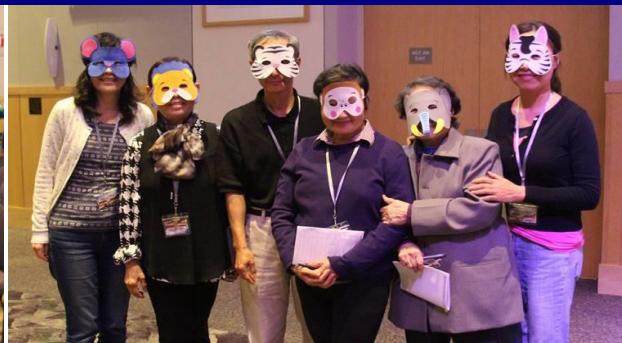
(上圖) 神秘！我們玩的就神秘！其實我們最後連自己也鬧不清誰是誰了。