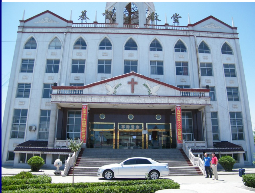
(圖二) 重建教會今日之新堂

這份寶貴的教會歷史記錄，希望《回首百年殉道血》一書再版時，把這份歷史全文加回本書上，紀念先賢殉道者所留下的佳美腳蹤。◇