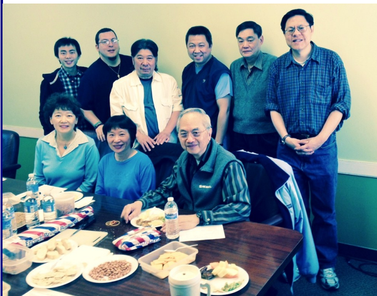
宣道部同工經常在開同工會時一同享用精美的點心。