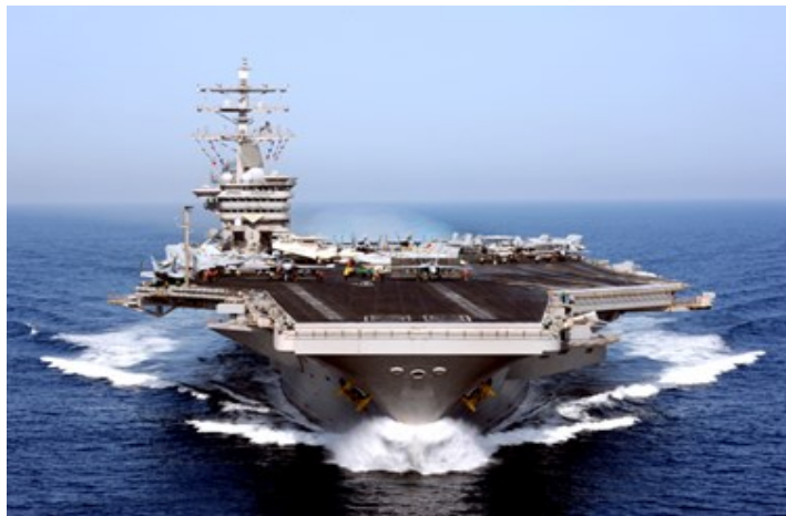
乘長風，破萬里浪！教會像一艘被神呼召的航空母艦

我們需要每一位弟兄姐妹加入我們的行列，在主內同心，竭力追求！我的禱告和希望是：願你加入我們，忘記過去所有的失敗、成功和阻礙，一起同心，奮勇向前，向着神的榮耀直跑！◇