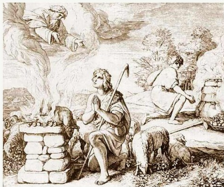
該隱與亞伯獻供物